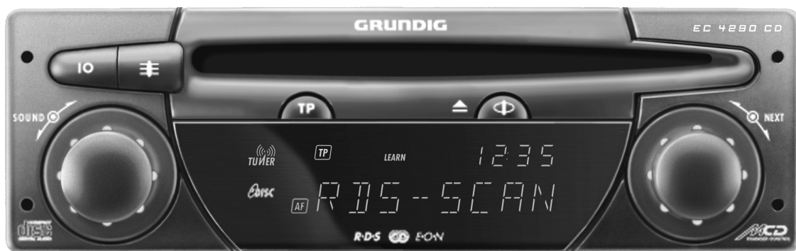
EC 4290 CD (9.18329-8151 / G.HG 42-00)